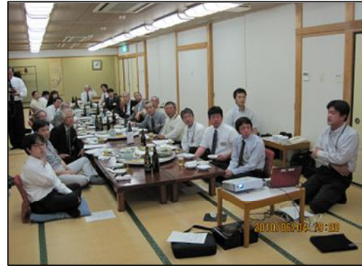
揚水発電発表への質問 及び 歓談